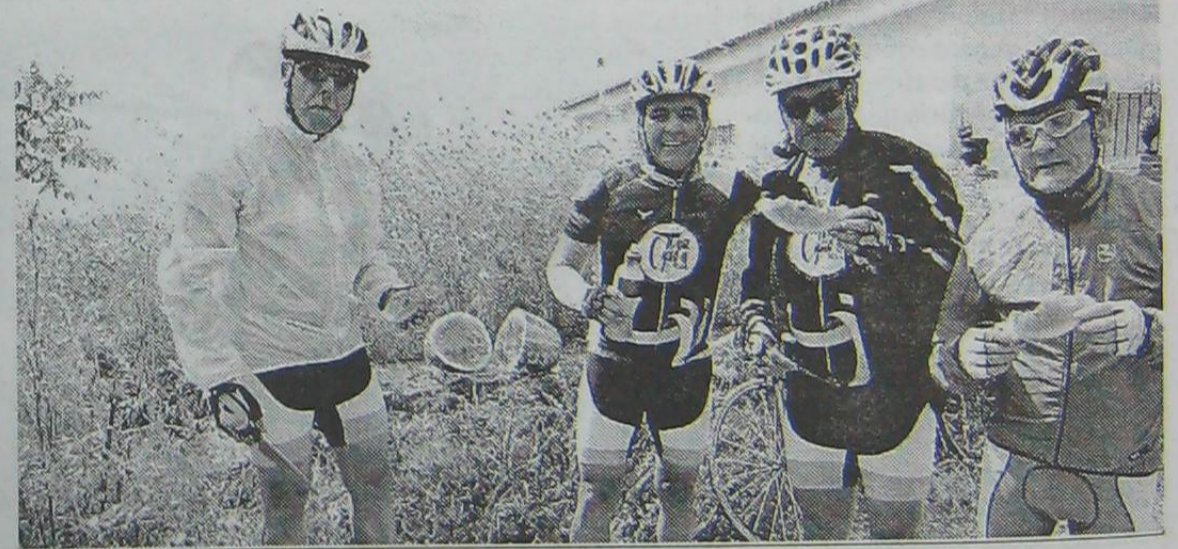
Numerosas paradas para reponer fuerzas.