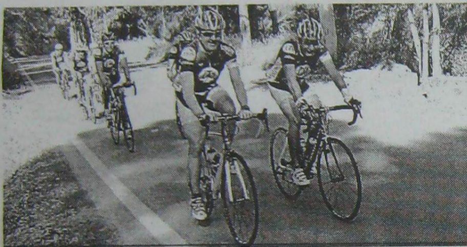
Gran nivel de cicloturismo en nuestra ciudad.