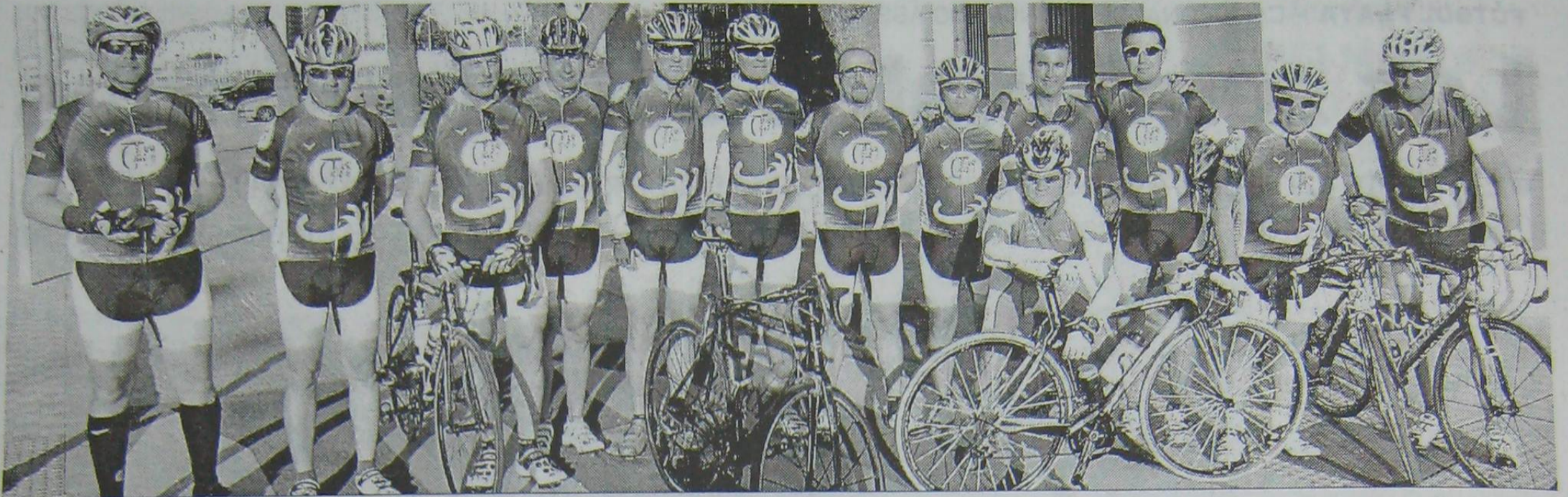
Componentes de la expedición del Ciclotur que se desplazaron hasta tierras malagueñas.