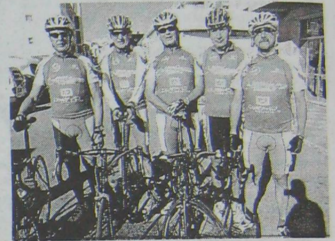
Algunos de los componentes del Ciclotur.