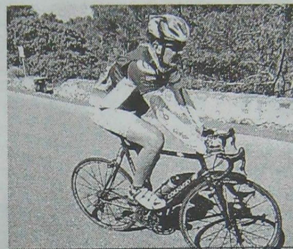
El Puerto del León puso la dureza.